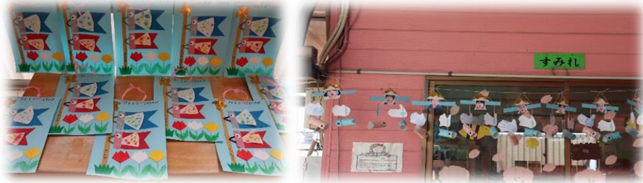
各クラスのこいのぼり・・・